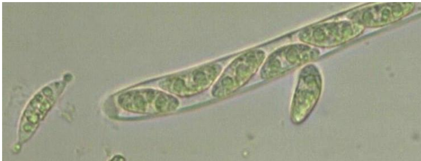
Photo ci-dessus : A gauche une spore éjectée produit aux extrémités des spores secondaires (conidies?)

Les spores ne deviennent septées qu'à pleine maturité, dans le cas présent les apothécies étaient jeunes et de petites taille (2 à 5 mm de diamètre)