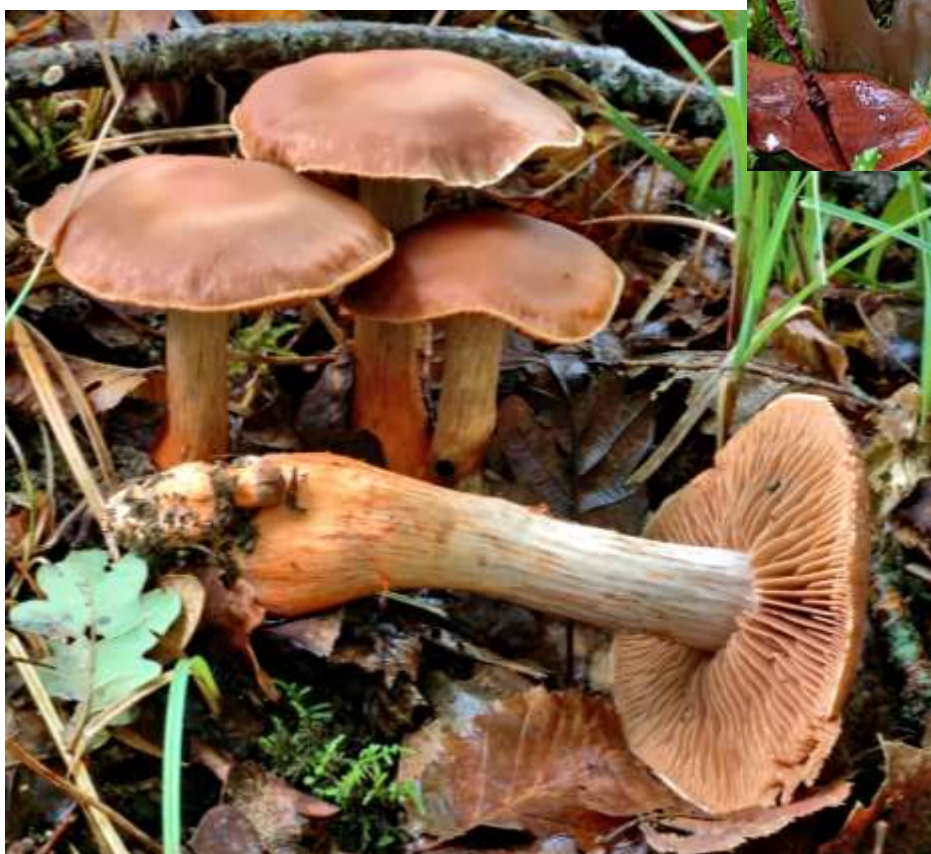
← Cortinarius bulliardii (Cortinaire de Bulliard)