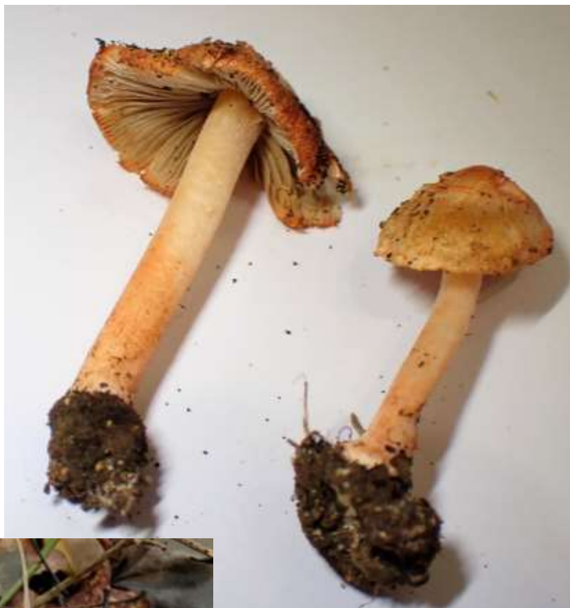
Inocybe pudica → (Inocybe pudique)