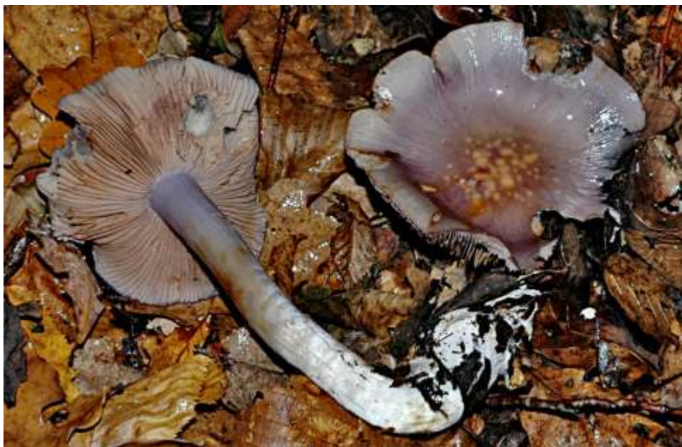
← Cortinarius salor (Cortinaire couleur de mer)