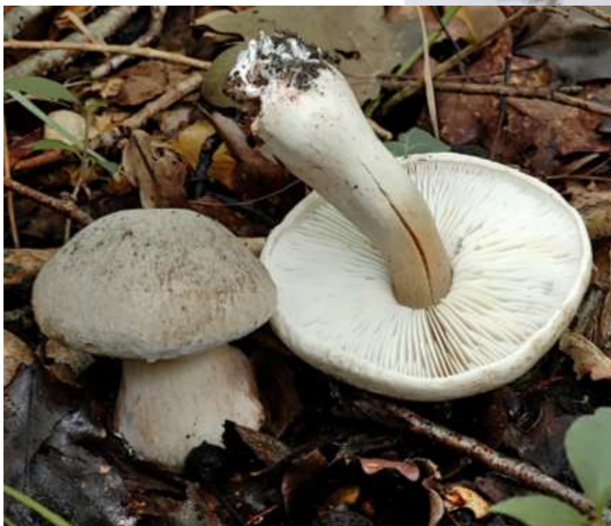
← Tricholoma basirubens (Tricholome à base rougissante)