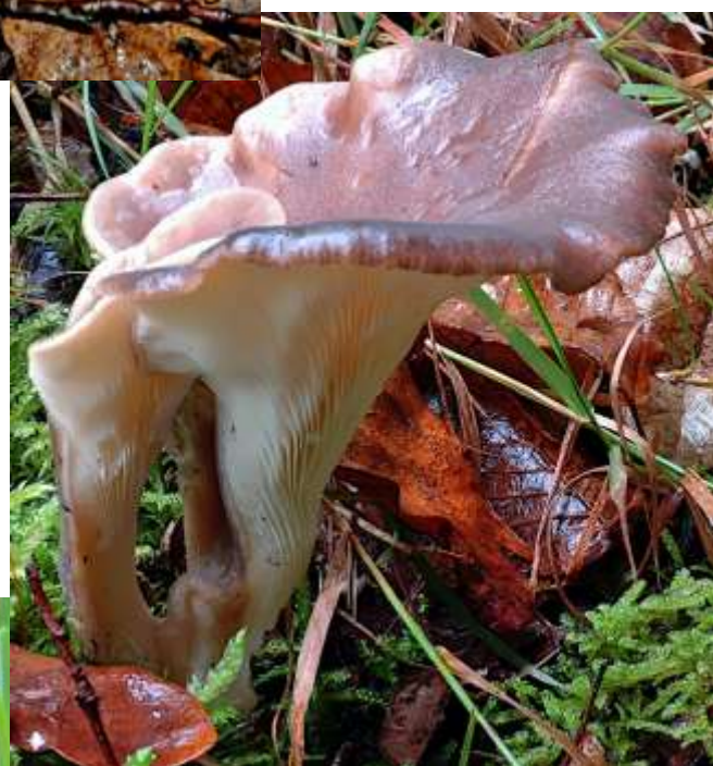
Hohenbuehelia geogenia → (Pleurote terrestre)